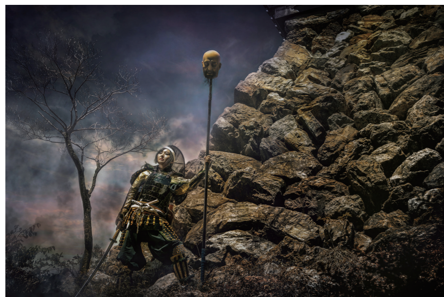
「刹那」 鷲津敬之氏 Score : 82 (シルバー)